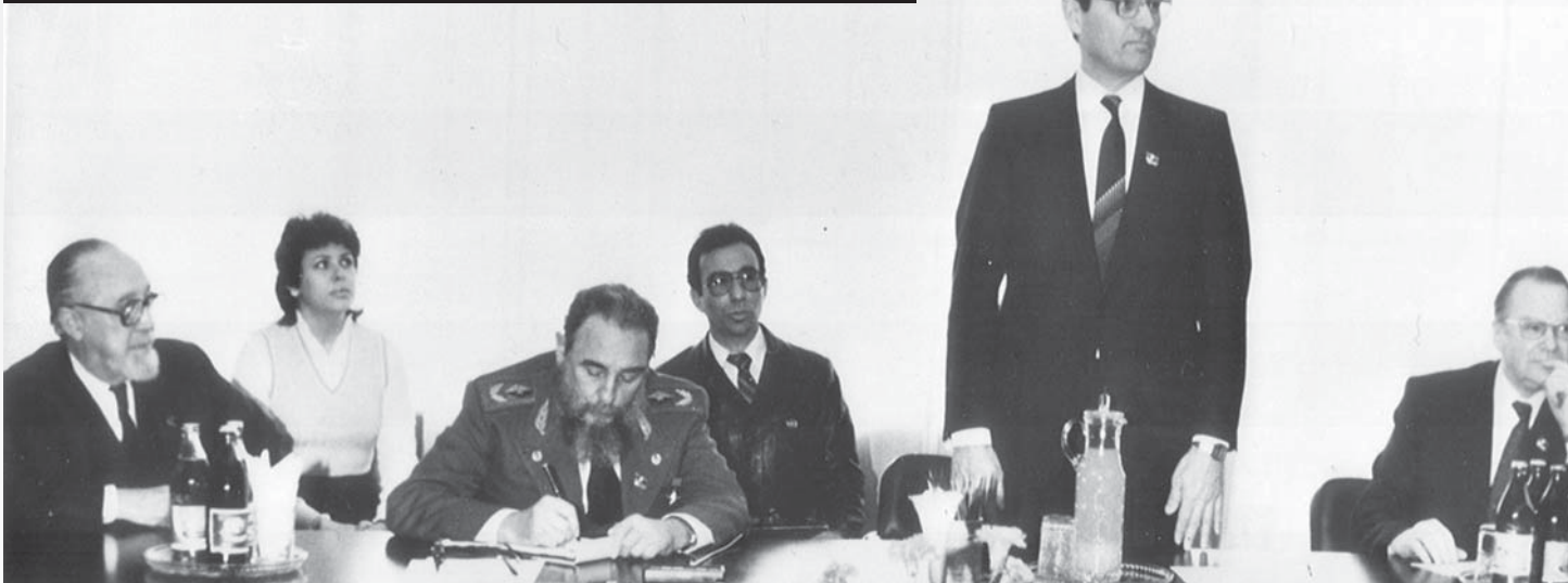
Ю.А. Овчинников принимает Председателя Государственного совета Кубы Фиделя Кастро в Институте биоорганической химии имени академика М.М. Шемякина АН СССР. 1985 г.

Фидель Кастро делился размышлениями о том, что реализация задач социалистического проекта сама по себе не делает людей счастливыми, рост материального достатка без обогащения духовной сферы человека незаметно деформирует шкалу ценностей так, что духовная сфера начинает обедняться. Между двумя одинаково важными процессами может даже возникнуть антагонизм. В теории социализма формально эта проблема сформулирована, но совершенно