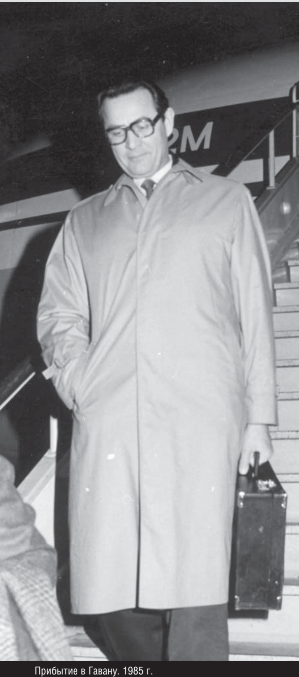
Прибытие в Гавану. 1985 г.

В августе 2019 г. мы будем отмечать 85 лет со дня рождения одного из титанов советской науки академика Юрия Анатольевича Овчинникова, сыгравшего решающую роль в становлении отечественной биоорганической химии, физико-химической биологии и биотехнологии. А в феврале Институт биоорганической химии имени М.М. Шемякина и Ю.А. Овчинникова, который Юрий Анатольевич возглавлял в течение 18 лет, отметил свой 60-летний юбилей. Эти юбилейные даты — повод оглянуться назад и отдать дань памяти удивительному человеку, чьи дела и свершения были направлены в будущее.