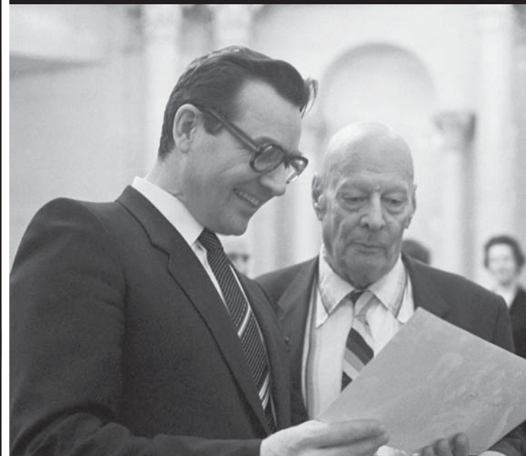
Фото: Фотохроника ТАСС / Анатолий Морковкин. Вице-президент АН СССР академик Ю.А. Овчинников и президент АН СССР А.П. Александров (слева направо) в перерыве между заседаниями Президиума АН СССР. 1984 г.