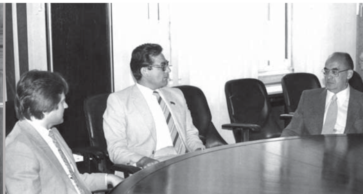
В Институте биоорганической химии имени академика М.М. Шемякина АН СССР с экс-президентом Мексики Луисом Эчеверри Альваресом. 1985 г.

Он считал науку и искусство двумя сторонами стремления человека к истине, красоте, гармонии и познанию законов природы.