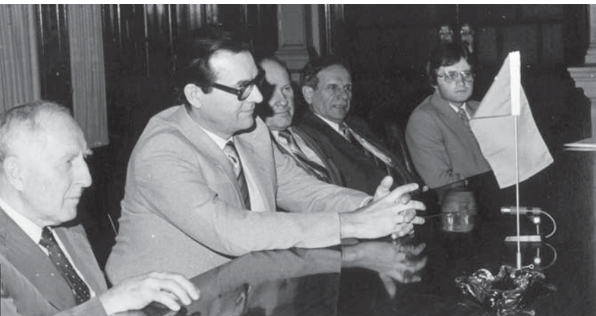
Советская делегация на переговорах в АН Кубы. 1985 г.

Как директор института Ю.А. Овчинников мечтал создать самый совершенный и передовой исследовательский центр, где ученым были бы созданы наилучшие условия для творческого труда. В середине 1970-х годов он добился решения о строительстве для ИБХ нового современного здания. При обсуждении вопросов финансирования «наверху» настаивали на реали-