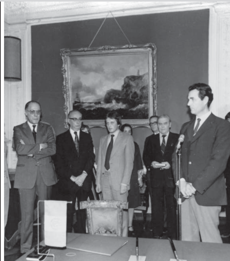
Награждение академиков Ю.А. Овчинникова и А.А. Логунова медалями перуанского Национального университета Сан-Маркос. Москва, Дом ученых. 1980 г.

Если бы Ю.А. Овчинников не ушел из жизни так рано, то, несомненно, стал бы вторым в истории России химиком — лауреатом Нобелевской премии.