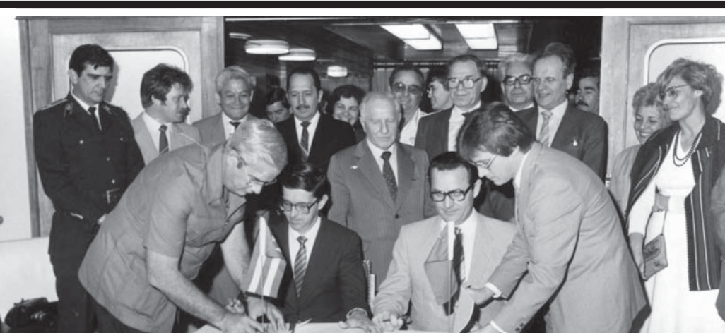
Подписание соглашения между АН СССР и АН Кубы о научном сотрудничестве. 1985 г.

«Могу», — говорил Ю.А. Овчинников в любых обстоятельствах и добивался блестящих результатов во всем, за что бы ни брался — покорял Красноярские столбы и, поражая коллег, отвес-