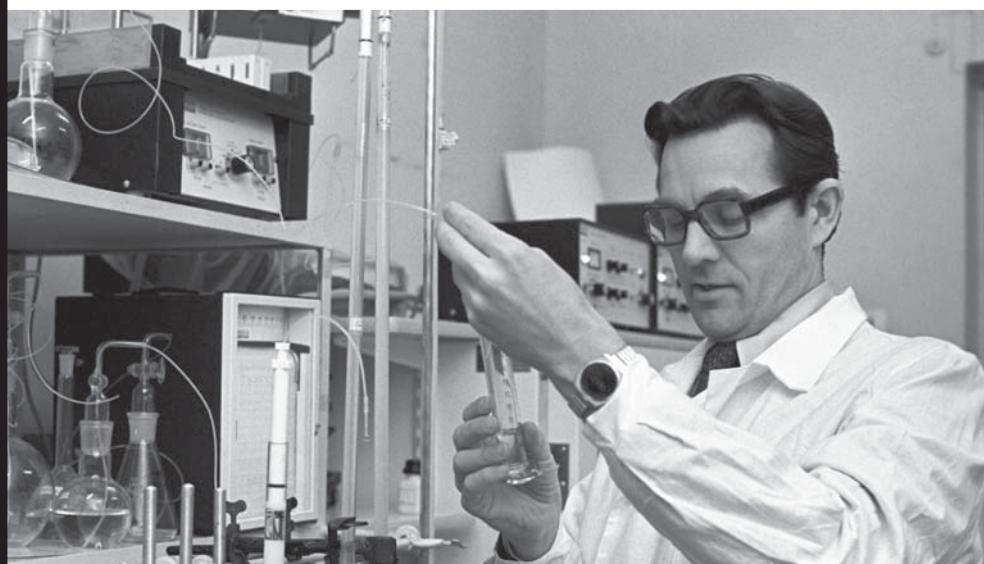
Академик Ю.А. Овчинников в своей лаборатории за исследованиями. Москва, Институт биоорганической химии имени М.М. Шемякина АН СССР. 1977 г.