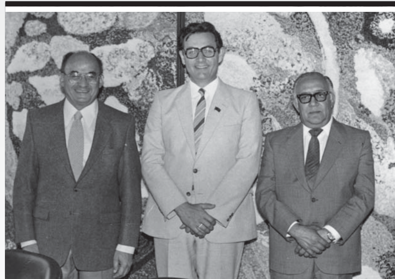
Слева направо: экс-президент Мексики Луис Эчеверриа Альварес, Ю.А. Овчинников и посол Мексики в СССР Орасио Флорес де ла Пенья

«Он обладал французским обаянием, итальянским темпераментом, немецкой деловитостью, искренностью и прямоотой американца, сердечностью русского. Какое сочетание!» — написал о Ю.А. Овчинникове нобелевский лауреат, специалист по молекулярной биологии Гюнтер Блобель. С этими словами согласятся все, кто знал Юрия Анатольевича. Но все эти качества — скорее внешнее описание человека. А по своему внутреннему содержанию это был