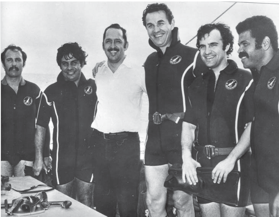
Ю.А. Овчинников с президентом Академии наук Кубы на корабле АН Кубы

1981 и 1985 гг. было принято три постановления ЦК КПСС и Правительства СССР о развитии молекулярной биологии, предусматривающих комплекс мер по строительству, финансовой и кадровой поддержке большого числа научных центров. Реализация этих мер позволила осуществить громадный скачок в развитии отечественной биологии и биотехнологии и прак-