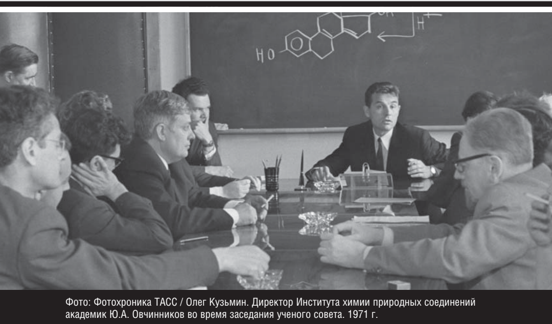
Директор Института химии природных соединений академик Ю.А. Овчинников во время заседания ученого совета. 1971 г.