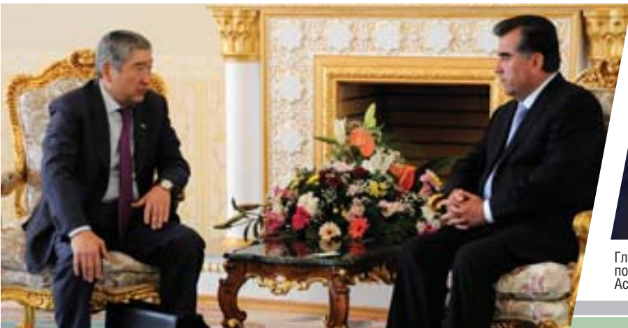
Встреча с Президентом Таджикистана Э. Рахмоном. Душанбе, 2008 г.