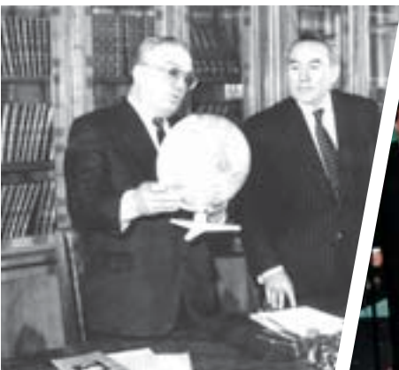
Президент Казахстана Н.А. Назарбаев представляет проект «О формировании Евразийского союза государств». Москва, МГУ им. М.В. Ломоносова, 29 марта 1994 г.