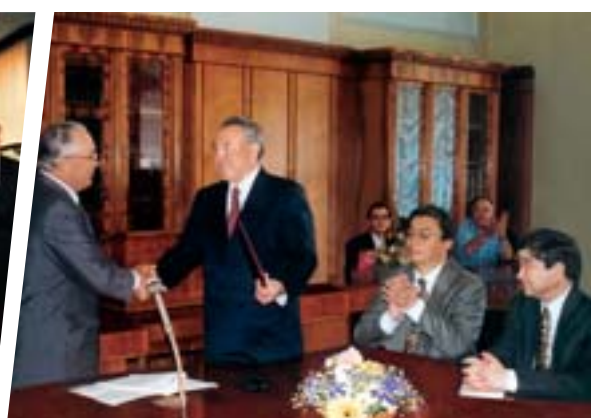
Ректор МГУ В.А. Садовничий вручает Президенту Казахстана Н.А. Назарбаеву диплом Почетного профессора МГУ. 16 мая 1996 г.