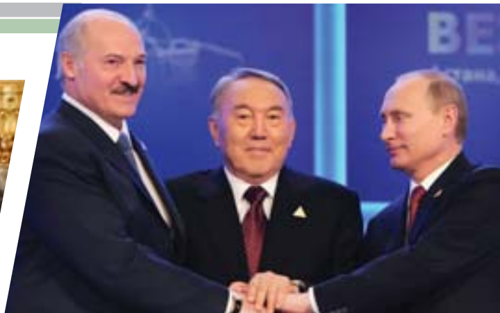
Главы государств Н.А. Назарбаев, В.В. Путин и А.Г. Лукашенко подписали Договор о Евразийском экономическом союзе. Астана, 29 мая 2014 г.

дународной арене стали Европейская экономическая комиссия ООН, Экономическая и социальная комиссия ООН для стран Азии и Тихого океана, Программа развития ООН по промышленному развитию, МАГАТЭ, ЮНЕСКО и другие организации.