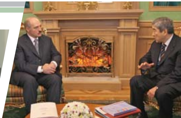
Встреча с Президентом Республики Беларусь А.Г. Лукашенко. Минск, 2008 г.