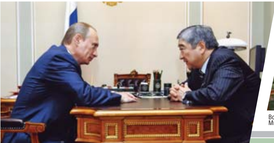
Встреча с Президентом РФ В.В. Путиным. Москва, 2008 г.