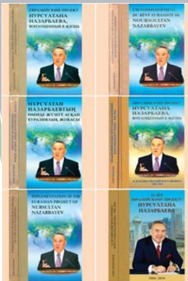
Издания, посвященные Евразийскому проекту Нурсултана Назарбаева, на русском, казахском, английском и французском языках. 2011–2019 гг.

Политическая воля глав государств, активная работа правительств стран-участниц и органов Сообщества позволили обеспечить разработку и принятие Межгоссоветом ЕврАзЭС международных документов по формированию ЕЭП за один год вместо планируемых двух. В ноябре-декабре 2010 г. Межгоссоветом ЕврАзЭС (Высшим органом Таможенного союза) был принят пакет из 17 базовых международных соглашений, формирующих правовую базу ЕЭП. Эти соглашения были ратифицированы, и 19 декабря 2011 г. на заседании Высшего Евразийского экономического совета главами трех государств было принято решение о введении их в действие с 1 января 2012 г., то есть о начале работы ЕЭП.