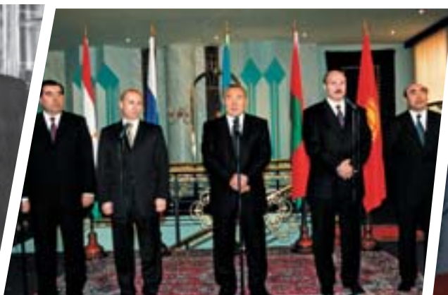
Главы государств Беларуси, Казахстана, Кыргызстана, России и Таджикистана учреждают Евразийское экономическое сообщество. Астана, октябрь 2000 г.