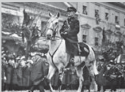
Адмирал Хорти на коне входит в Кошице