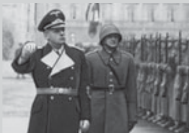
Иоахим Риббентроп перед фронтом роты почетного караула Войска польского. 1939 г.

Риббентроп. Дорогой министр, мы благополучно преодолели серьезный кризис и можем с оптимизмом смотреть в будущее.