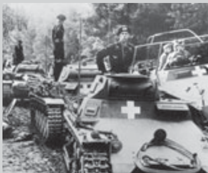
Немецкие танки Т-1 в Польше. 1939 г.

Гитлер. Что же у Вас получается, дорогой Риббентроп? Можете объяснить, что происходит с Францией? С Варшавой?