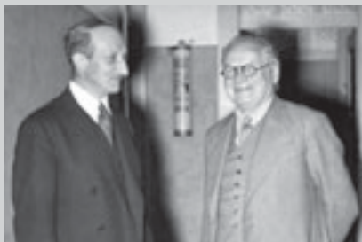
Жорж Боннэ и М.М. Литвинов. 1938 г.