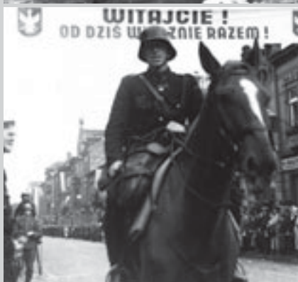
Захват поляками чешского города Тешин