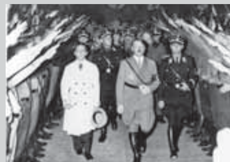
Адольф Гитлер и Йозеф Геббельс