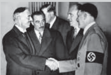
Невилл Чемберлен и Адольф Гитлер