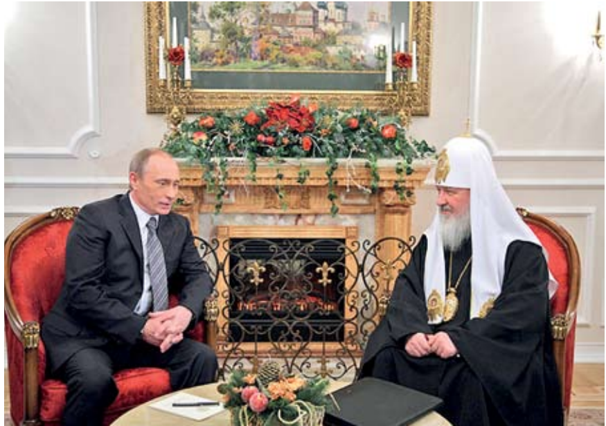
Встреча Патриарха Московского и всея Руси Кирилла с Председателем Правительства Российской Федерации В.В. Путиным

Другой задачей, требующей решения, остается возрождение духовного кода нации, ее идентичности через формирование института духовного лидерства национального масштаба. «Для подлинного и устойчивого успеха, состоящего в формировании и внедрении новой парадигмы развития, российское лидерство