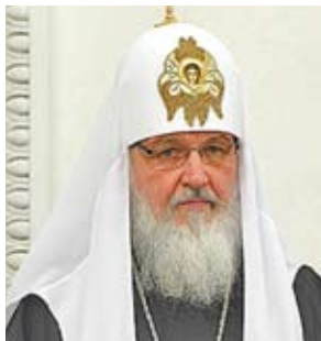
Кирилл, Патриарх Московский и всея Руси

Главным итогом работы Патриарха Кирилла эксперты называют заметно возросшую роль Православной церкви в публичной жизни России, отмечают важные шаги, предпринятые им на пути модернизации РПЦ. В этом направлении патриарх Кирилл работал с первых дней, как возглавил Русскую Православную Церковь: он инициировал создание системы военных священников и внедрение в школе курса основ религии и светской этики. Важной приметой нового патриаршества стала активизация диалога церкви и общества, межконфессионального общения.