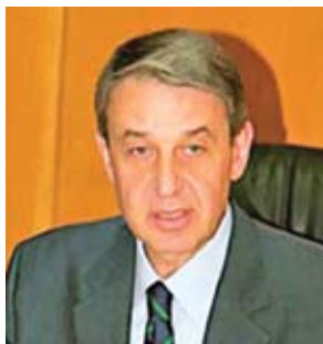
Александр Алексеевич Авдеев,

В 2010 г. Патриарх Кирилл направлял значительные усилия на работу с молодежью, активно утверждая миссионерскую функцию РПЦ в отношении с этой важнейшей частью нации. «Мне кажется, что очень многие молодые люди сегодня не туда подставляют лестницу, — заявил Патриарх Кирилл. — Они даже треть пути не пройдут. Они сорвутся. Вот почему мне хочется встречаться с молодежью. Хочется сказать им что-то из собственного опыта. Даже не столько от своего — от тысячелетнего опыта Церкви. Но передать это в словах, понятных молодым людям».