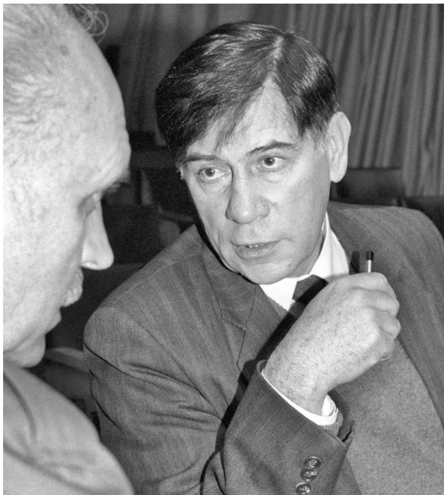
Фото: Фотохроника ТАСС / Роберт Нетелев. Президент Российской национальной службы экономической безопасности Л.В. Шebarшин, 1993 г.

Человеку нужно очень немного для счастья и еще меньше для несчастья. Л.В. Шebarшин. Хроники безвременья. — М.: Русский биографический институт, 1998.