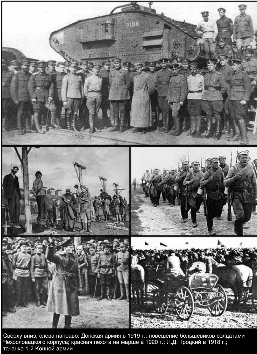
Сверху вниз, слева направо: Донская армия в 1919 г.; повешение большевиков солдатами Чехословацкого корпуса; красная пехота на марше в 1920 г.; Л.Д. Троцкий в 1918 г.; тачанка 1-й Конной армии