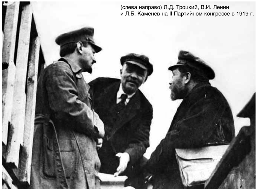
(слева направо) Л.Д. Троцкий, В.И. Ленин и Л.Б. Каменев на II партийном конгрессе в 1919 г.