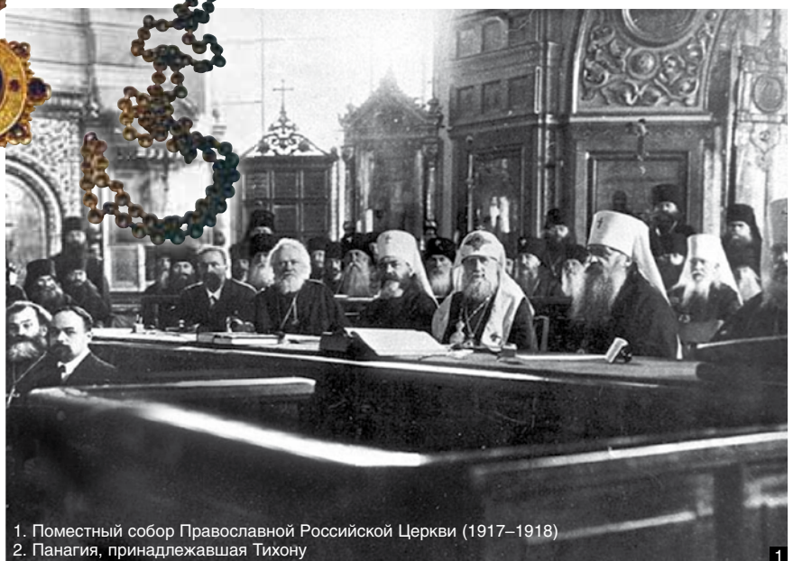
1. Поместный собор Православной Российской Церкви (1917–1918)