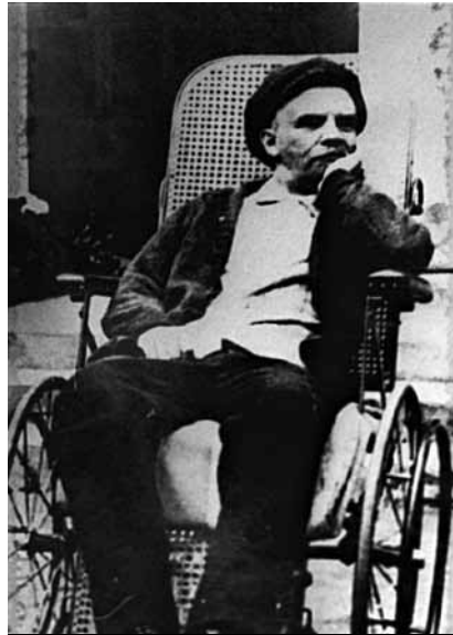
В.И. Ленин в Горках во время болезни, 1923 г.

Однако не только личные отношения в Политбюро и карьерные устремления отдельных руководителей определяли курс страны. Подавляющее большинство партийных лидеров, за которыми стояли сотни тысяч рядовых коммунистов, выступали за мирный путь развития, понимали, что мировая революция откладывается надолго. Троцкий для них был неприемлем, они хотели закрепить достигнутое, а не погибнуть на баррикадах где-нибудь в Сак-