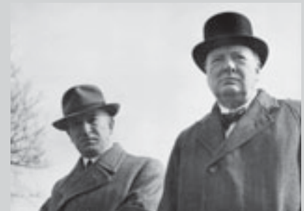
Эдвард Бенеш и Уинстон Черчилль