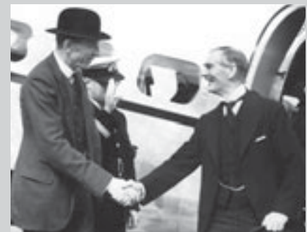
Невилл Чемберлен и Эдуард Галифакс