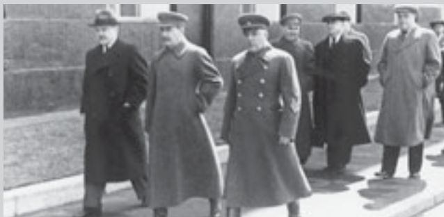
В.М. Молотов, И.В. Сталин и К.Е. Ворошилов

Ворошилов. У французов 110 дивизий, четыре тысячи современных танков, три тысячи пушек крупного калибра от 150 до 420 миллиметров. Войска прикрытия будут готовы в течение шести часов и займут всю границу. Укрепления имеются по всей границе, линия Мажино продолжена до моря. Меньше чем в десять дней будут подведены все основные силы, причем две трети будут на месте сосредоточения через восемь дней, остальные — на два дня позже. Имеется шестимесячный запас материалов и снаряжения. За это время промышленность успевает произвести необходимые объемы... Что еще? Издан закон: все рабочие объявляются мобилизованными наравне с солдатами, правительство может мобилизовать необходимое количество рабочих для военных заводов... У англичан 16 дивизий... Но главное в другом. Я задал вопрос: предполагают ли генеральные штабы Великобритании и Франции, что советские сухопутные войска будут пропущены