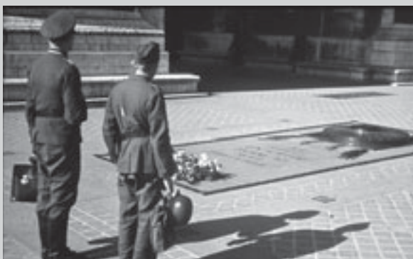
Варшава, Могила Неизвестного Солдата

Голоса. Мы дали присягу! Мы будем летать, будь они прокляты!