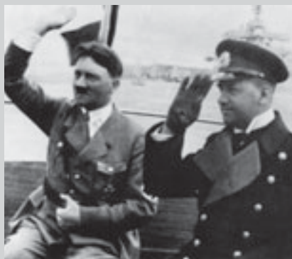
Адольф Гитлер и Эрих Редер