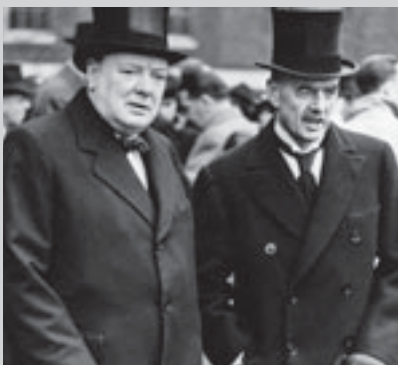
Уинстон Черчилль и Невилл Чемберлен