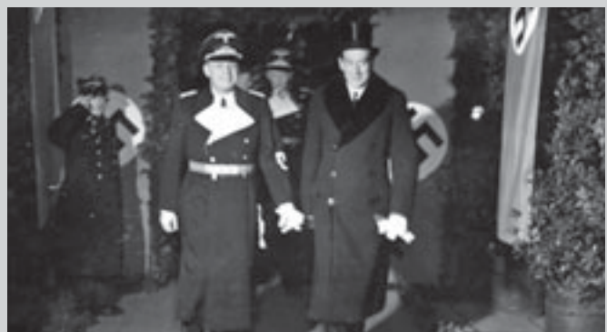
Иоахим Риббентроп и Юзеф Бек