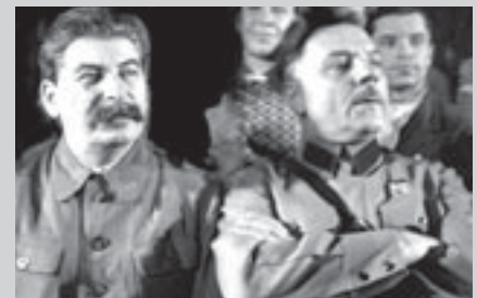
И.В. Сталин и К.Е. Ворошилов