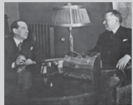
Юзеф Бек и М.М. Литвинов