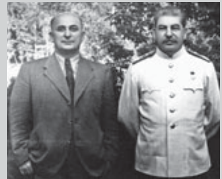
И.В. Сталин и Л.П. Берия

Риббентроп. У нас есть сообщения о сосредоточении и стягивании к границе польских войск. Обращаю Ваше внимание на возможные серьезные последствия. Польская позиция мне кажется странным ответом на мое недавнее предложение об окончательном решении германо-польских отношений.