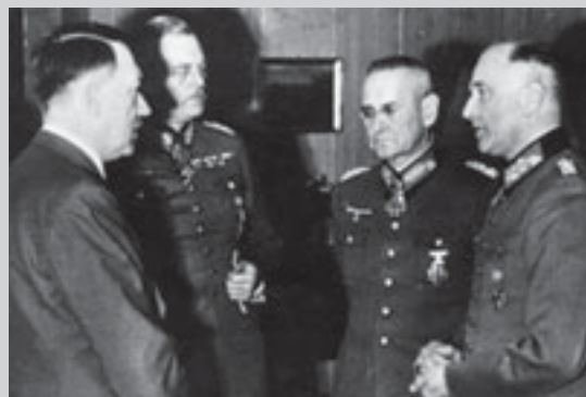
Адольф Гитлер, Вильгельм Кейтель, Франц Гальдер, Вальтер фон Браухич