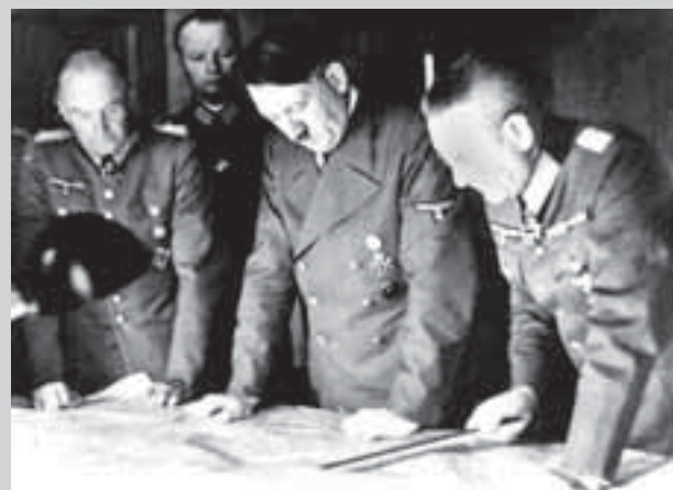
Адольф Гитлер, Вальтер фон Браухич и Франц Гальдер