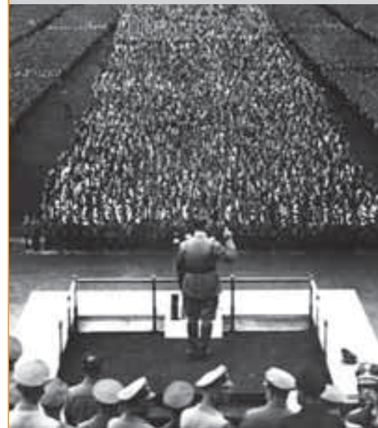
Съезд нацистской партии в Нюрнберге