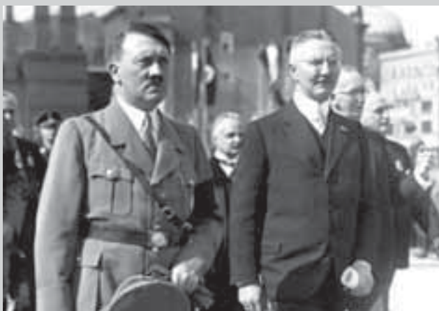
Адольф Гитлер и Ялмар Шахт

Гальдер. В том-то и дело. Надо избежать неумного риска.