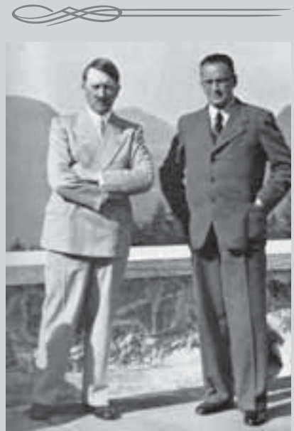
Адольф Гитлер и Конрад Генлейн