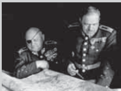
Ян Сыровы и Людвик Крейчи