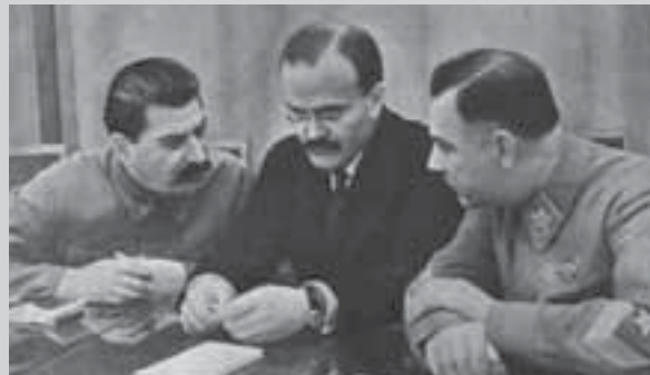
И.В. Сталин, В.М. Молотов и К.Е. Ворошилов