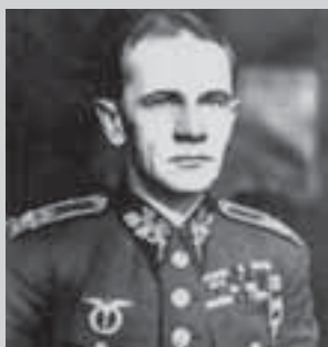
Генерал С.Н. Войцеховский

Сыровы. Гитлер получит отпор. У нас самая сильная армия в Восточной Европе.