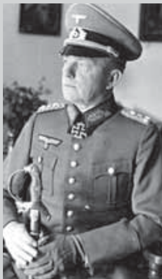
Эвальд фон Клейст-Шменцин