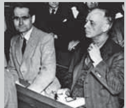
Рудольф Гесс и Иоахим фон Риббентроп