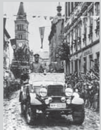
Фюрер едет по городу Граслиц в Судетской области, 1938 г.