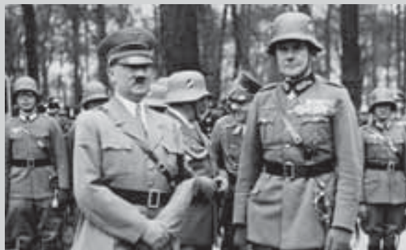
Адольф Гитлер и Вернер фон Бломберг