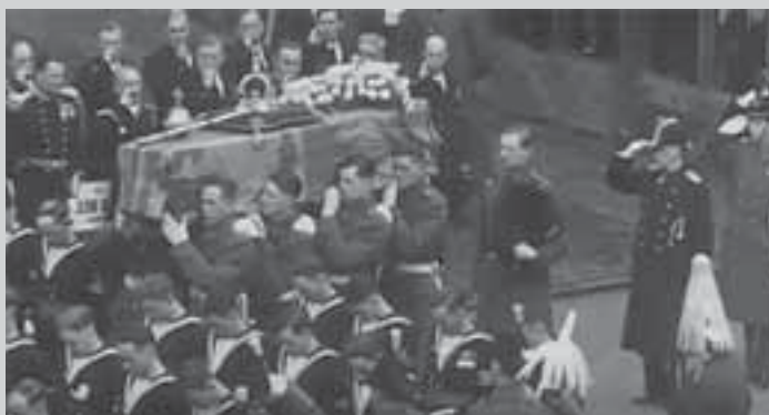
Похороны короля Великобритании Георга V