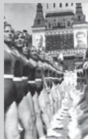
Красная площадь. Парад физкультурников, 1936 г.