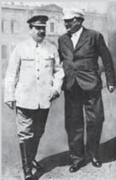
И.В. Сталин и Г.М. Димитров