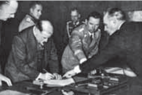
Иоахим фон Риббентроп указывает Эдуарду Даладье место для подписи. Подписание Мюнхенского соглашения, 29 сентября 1938 г.