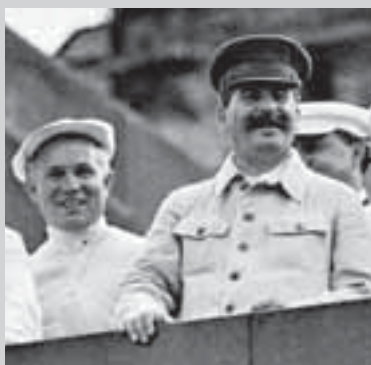
Н.С. Хрущев и И.В. Сталин на Параде физкультурников, 1936 г.