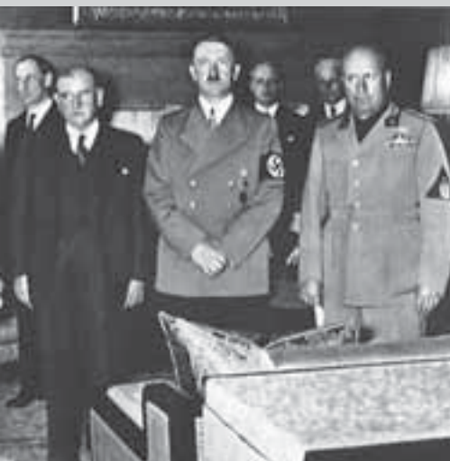
Мюнхенская конференция, 29–30 сентября 1938 г. Слева направо: Невилл Чемберлен, Эдуард Даладье, Адольф Гитлер, Бенито Муссолини

зал, что, например, Британская империя близка к упадку, мировое лидерство переходит к континентальным государствам, прежде всего к Германии. Напомню его мысль: пространство — это фактор силы.