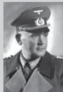
Вернер фон Бломберг