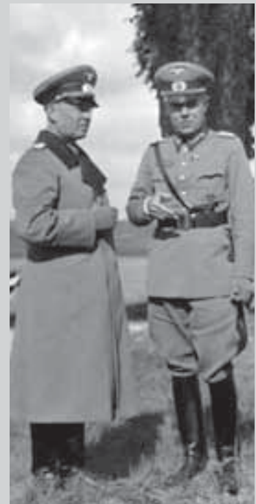
Людвиг Бек и Вернер фон Фрич