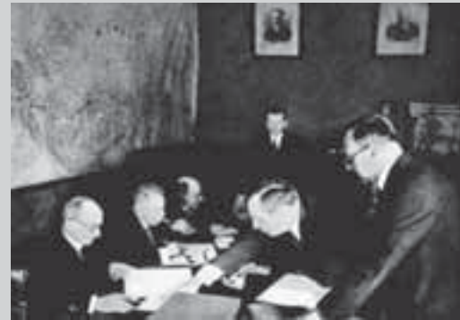
Подписание советско-чехословацкого договора о взаимной помощи, 1935 г.