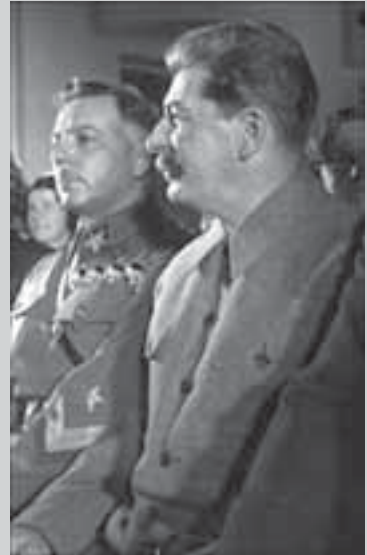
И.В. Сталин и К.Е. Ворошилов