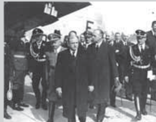
Премьер-министр Франции Эдуард Даладьё прибыл на Мюнхенскую конференцию