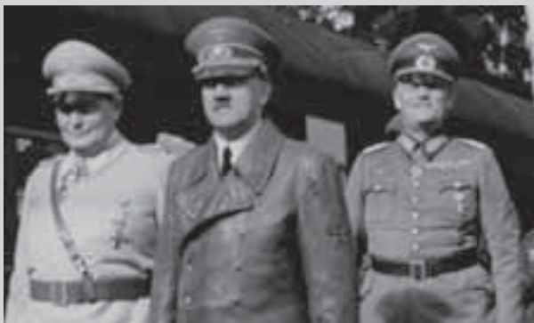
Герман Геринг, Адольф Гитлер и Вильгельм Кейтель

Бек. Германская армия всегда следовала принципу равной ответственности армии и рейха. Уж если мы имеем невыгодное геостратегическое положение, то единственно правильный путь — избегать вооруженных конфликтов. К мнению армии надо прислушаться, мой фюрер.