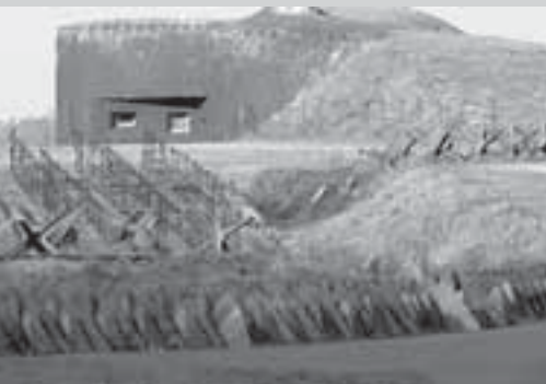
Бункер чехословацкой линии укреплений в Судетской области, известной как линия Бенеша