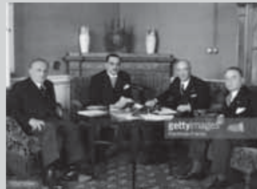
Камиль Крофта, Милан Стойдинович, Эдвард Бенеш и Виктор Антонеско