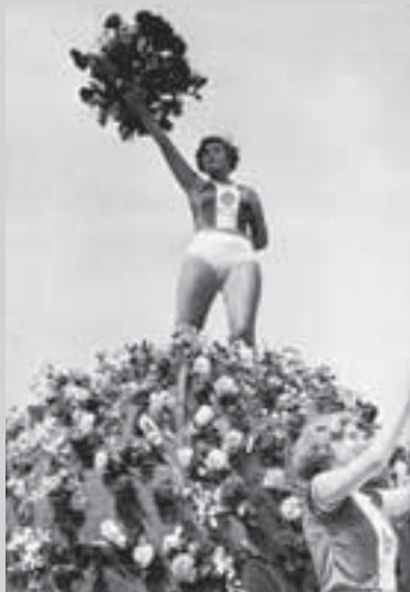
Красная площадь. Парад физкультурников, 1936 г.

Пятницкий. Значит, Муссолини будет вынужден искать, к кому можно прислониться. И это будет Гитлер.