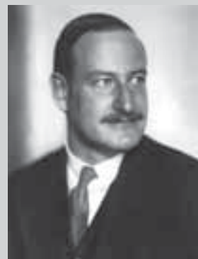
Альбрехт Георг Хаусхофер