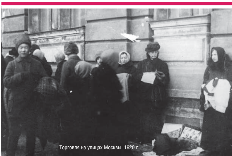
Торговля на улицах Москвы. 1920 г.

Ленин считал, что «никакого принципиального противоречия между советским (то есть социалистическим) демократизмом и применением диктаторской власти отдельных лиц нет» [15, с. 199]. Очевидно, в связи с этим Ленин называл Каутского «ренегатом», поскольку тот был против диктатуры пролетариата, выступал за проведение государством хозяйственной политики (в том числе и экспроприации) при «всестороннем согласии» [16, с. 142].