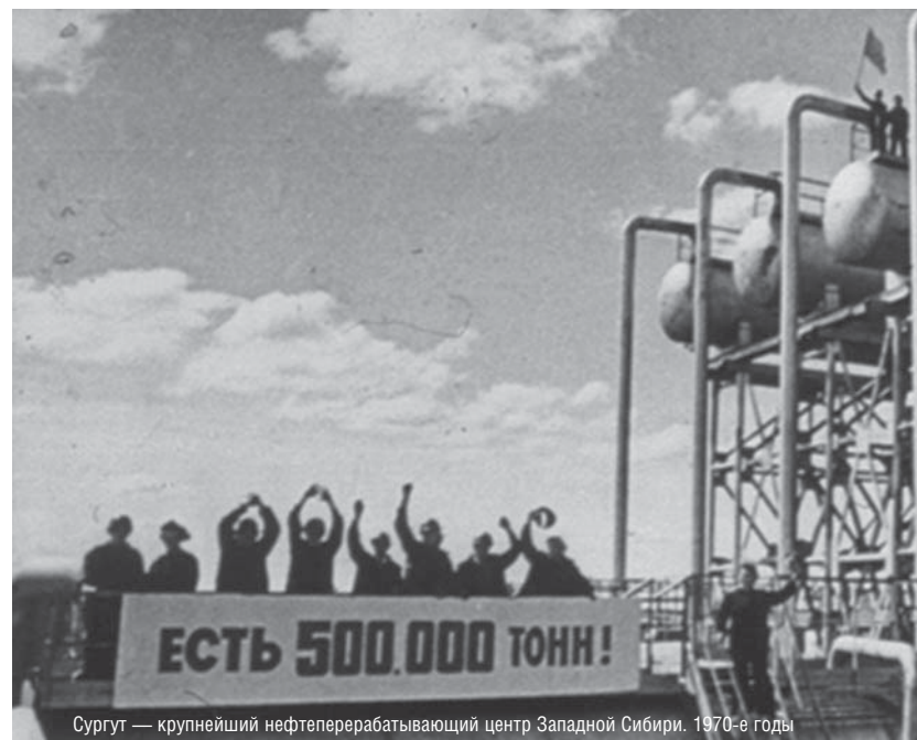
Сургут — крупнейший нефтеперерабатывающий центр Западной Сибири. 1970-е годы