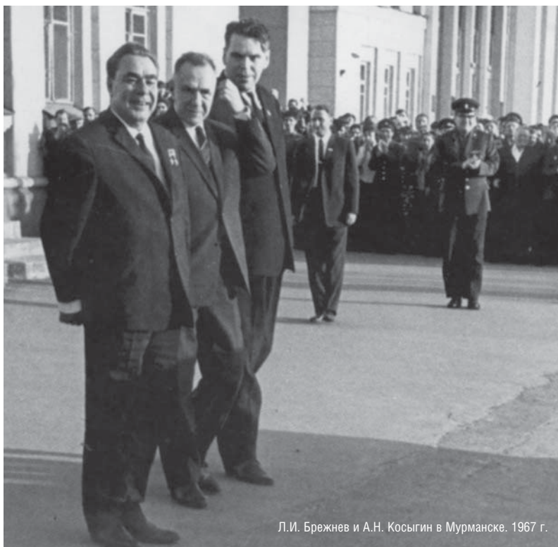
Л.И. Брежнев и А.Н. Косыгин в Мурманске. 1967 г.

на пользу централизованному аппарату власти <...>» [7, с. 41, 42]. Результатом стала победа государства «ультрабюрократического характера» [4, с. 524].