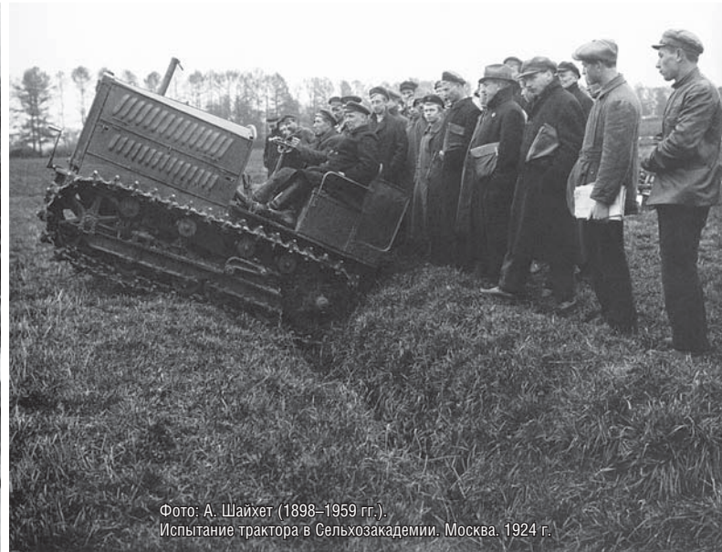
Фото: А. Шайхет (1898–1959 гг.). Испытание трактора в Сельхозакадемии. Москва. 1924 г.