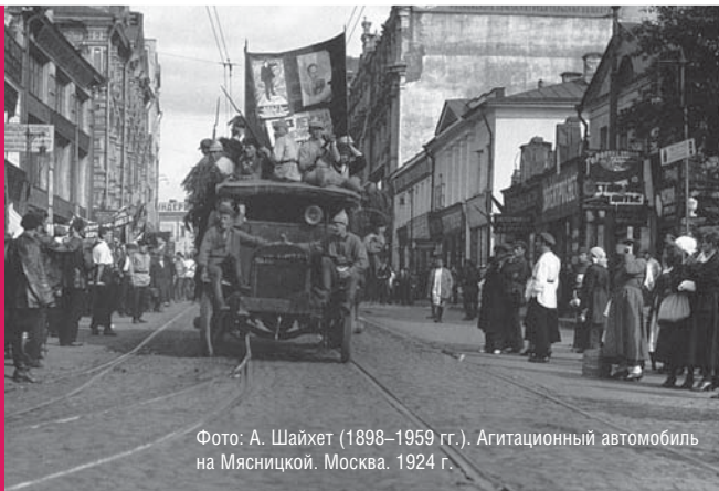
Агитационный автомобиль на Мясницкой. Москва. 1924 г.