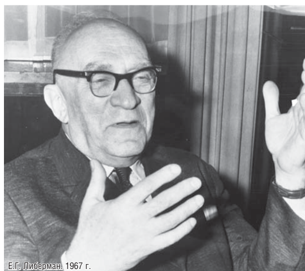
Е.Г. Либерман. 1967 г.

Реформа 1965 г. началась с упразднения созданных в 1957 г. государственных органов территориально-хозяйственного управления и планирования — советов народного хозяйства, или совнархозов, и превращения тем самым предприятий в основной субъект хозяйствования. Первоначально Либерман предложил при оценке работы предприятия перейти на интегральные показатели эффективности — прибыль и рентабельность, ввести критерий реализации продукции вместо валовых параметров, основополагающих для затратной советской экономики. Несмотря на сокращение числа директивных плановых показателей с 30 до 9, предполагалось сохранение их в натуральном выражении. К середине 1960-х годов производство валовой продукции, согласно отчетам, быстро росло. В реальности предприятия работали на склад (спроса на их продукцию не было), и все больше необходимых товаров становилось дефицитными.