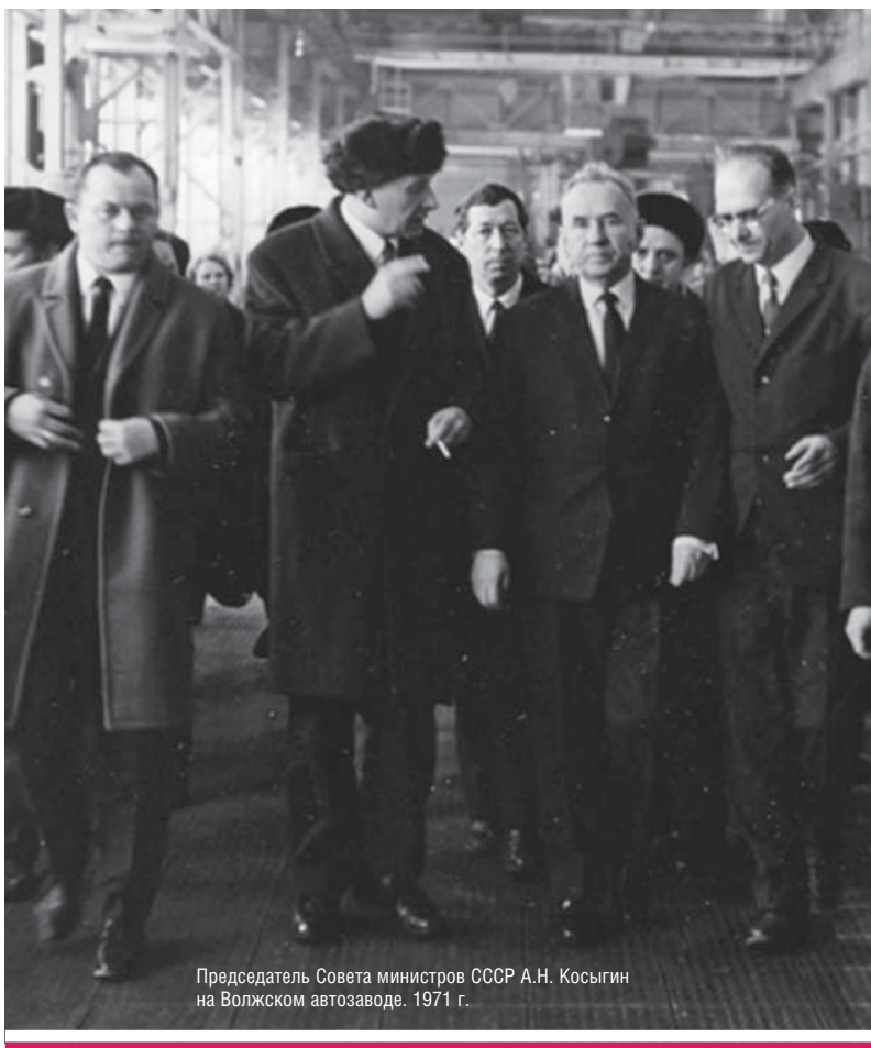
Председатель Совета министров СССР А.Н. Косыгин на Волжском автозаводе. 1971 г.

Сбои в хозяйственной системе продолжались вплоть до ее краха в конце 1980-х годов, когда падение цен на основной экспортный товар страны — нефть — наложило на колоссальные военные расходы. По оценкам конца 1980-х годов, если бы вся продукция советского машиностроения была оценена по мировым ценам, то доля вооружений составляла бы более 60% от общей суммы, а доля товаров народного потребления не превысила 5% [41, с. XXV].