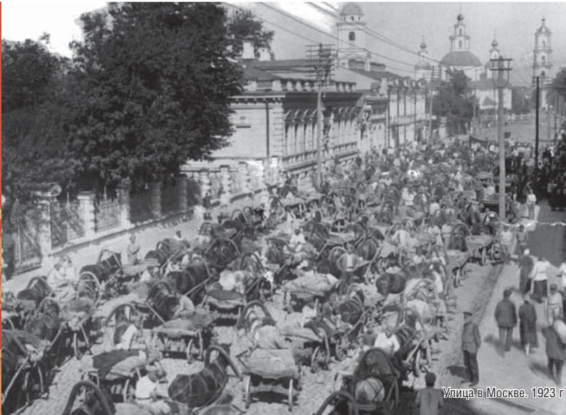
Улица в Москве. 1923 г.