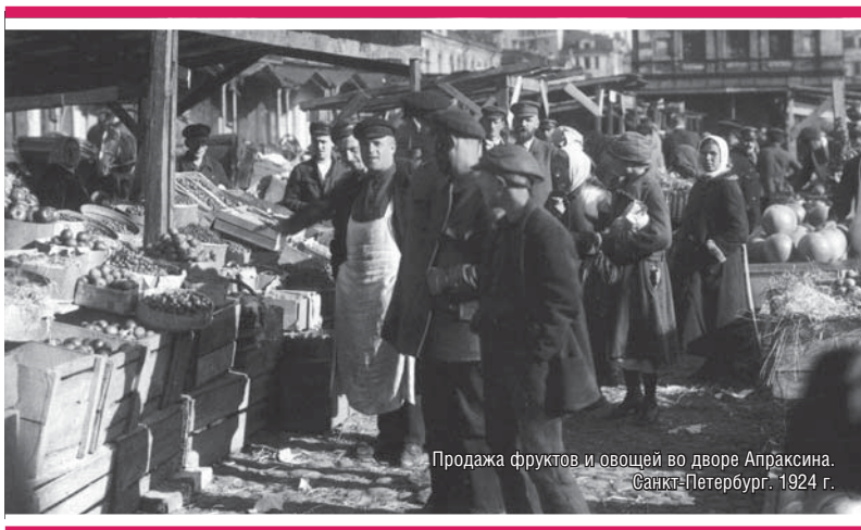
Продажа фруктов и овощей во дворе Апраксина. Санкт-Петербург. 1924 г.

Н.И. Бухарин считал НЭП отступлением с точки зрения «сознания» эпохи военного коммунизма. Фактически эта политика была первым шагом хозяйства, ориентирующимся на развитие производительных сил. НЭП, пишет Э. Каррер д'Анкосс, означал «возрождение промышленности, парализованной “военным коммунизмом”, <...> восстановление <...> капитализма, хотя и ограниченного и строго контролируемого» [19, р. 570–571].