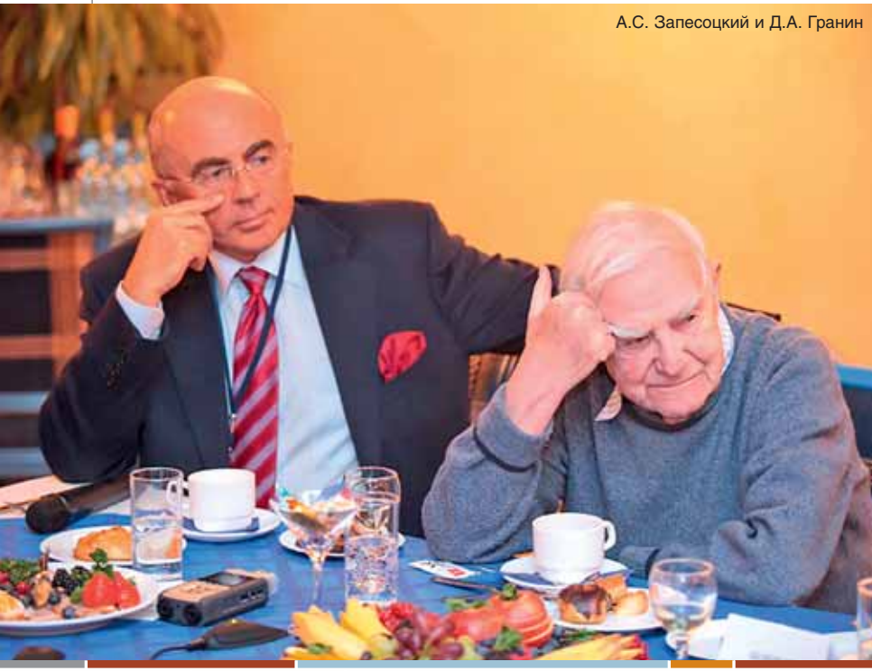
А.С. Запесоцкий и Д.А. Гранин

ления общественных наук РАН (28 апреля 2010 г.), Президиуме РАО (31 марта 2010 г.), а также тексты, изданные в последние годы в связи с выступлениями в Барселоне, Лондоне, Оттаве, Баку. «Это высшая из возможных форм апробации результатов научных исследований ученого» [2, с. 7].