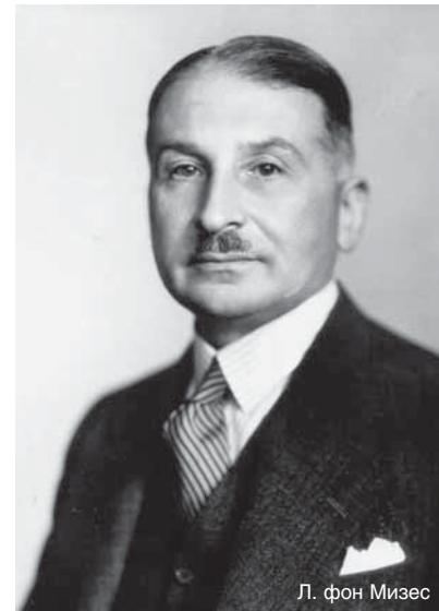
Л. фон Мизес

Внедрение конкуренции в сферу инфраструктуры, по мнению неолибералов, позволяет повысить качество и расширить набор предоставляемых услуг, снизить расходы государства и, соответственно, уровень налогообложения.