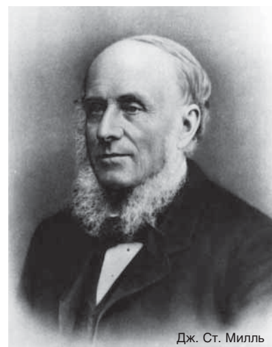
Дж. Ст. Милль

А. Маршалл (1842–1924), как и его предшественники-либералы, на первый план выдвигал свободу предпринимательства с опорой на конкуренцию, признавая и вмешательство государства в экономику для ее полноценного функционирования. При рассмотрении железнодорожного транспорта Маршалл задавался вопросом, что здесь более отвечает общественным интересам — конкуренция или ее отсутствие. «Когда производство целиком сосредоточено в руках одного лица или одной компании, — писал Маршалл, — возникающие при этом суммарные издержки обычно меньше» [13, т. II, с. 182], чем при наличии на рынке нескольких более мел-