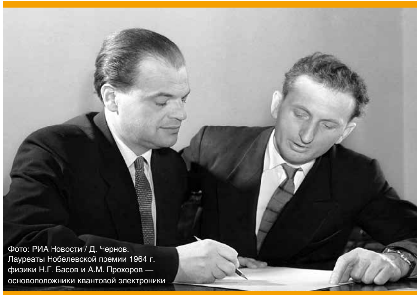
Фото: РИА Новости / Д. Чернов. Лауреаты Нобелевской премии 1964 г. физики Н.Г. Басов и А.М. Прохоров — основоположники квантовой электроники

Данный пример также характерен с точки зрения отсутствия в мире науки любых границ — временных, физических или идеологических. Научное со-