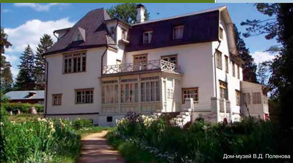
Дом-музей В.Д. Поленова

Слово — творение мысли, способное передать ясно и образно содержание явления. «Но если картину можно объяснить словами, — утверждал один из основоположников импрессионизма Пьер Огюст Ренуар, — она уже не является произведением искусства» [3–7]. Жизнерадостное, глубоко гуманистическое твор-