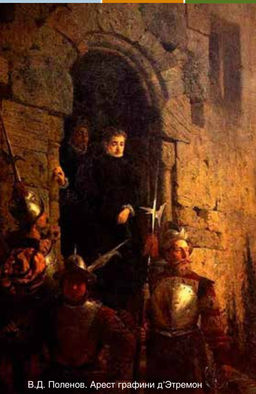
В.Д. Поленов. Арест графини д'Этремон

чество Ренуара оказало значительное воздействие на развитие реалистического искусства XX века [8]. Война, уступи место живописи!