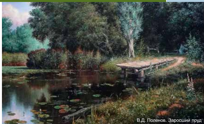
В.Д. Поленов. Заросший пруд

Во время заграничной командировки кроме многочисленных пейзажей, этюдов, зарисовок написал две жанровые картины, выступив в них против насилия над человеком и бесправия женщин: «Право госпо-