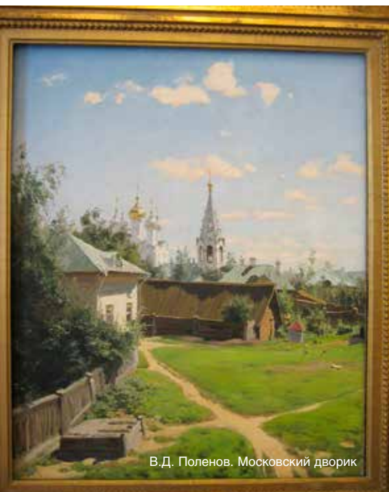
В.Д. Поленов. Московский дворик

дина» (1874 г.) и «Арест графини д'Этремон» (1875).