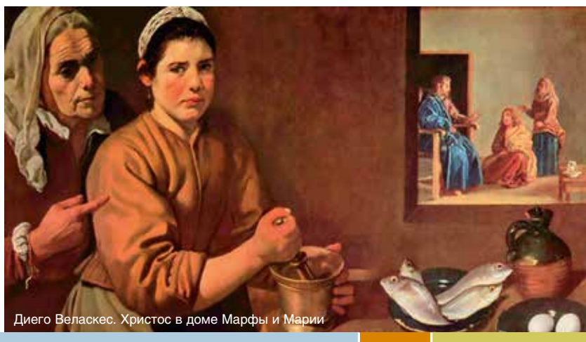
Диего Веласкес. Христос в доме Марфы и Марии

Особенно ярко проявился талант Веласкеса-портретиста, психолога, мыслителя и колориста в портрете Папы Иннокентия X, написанном художником во время второй поездки в Италию. Веласкес великолепно передал двойственность «наместника Христа на Земле»: смирение и алчность, величие и трусливую зависимость от всемогущей любовницы, спрятавшейся за драпировкой.