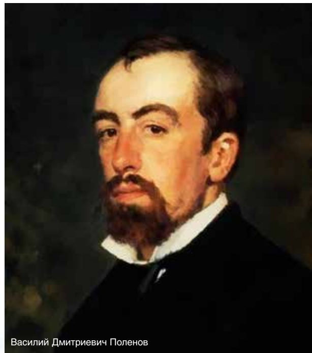
Василий Дмитриевич Поленов

Что роднит этих без преувеличения великих мастеров кисти? Реализм и отношение к самому страшному явлению в истории человечества — войне.