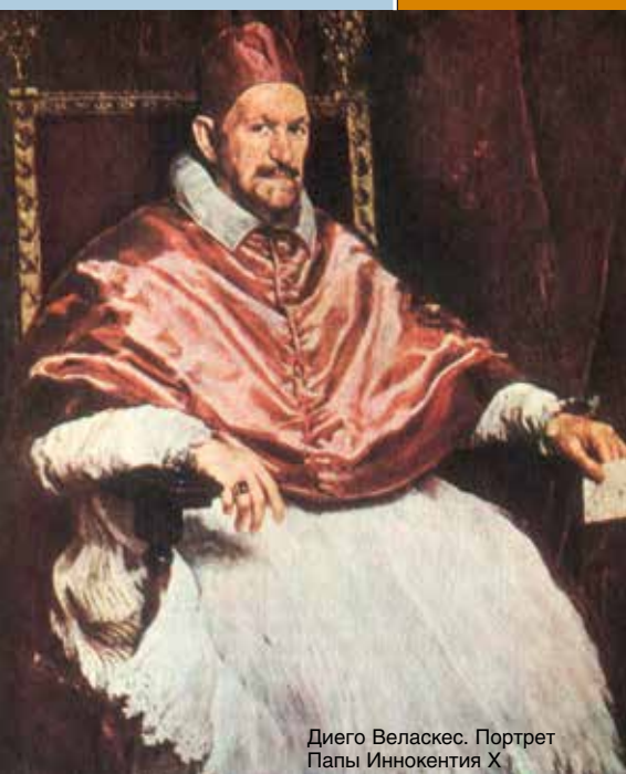
Диего Веласкес. Портрет Папы Иннокентия X

лии и в Неаполе), и он совершает первую поездку в Италию (1629–1635).