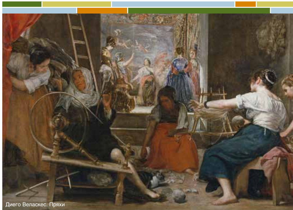
Диего Веласкес. Пряхи

«У меня во время копирования произведений Веласкеса душа горела. Давненько этого