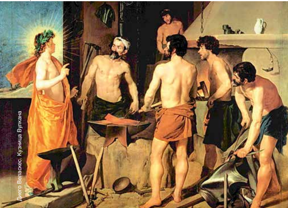
Диего Веласкес. Кузница Вулкана

инфанта Маргарита — она изображена в центре композиции в окружении придворных дам.