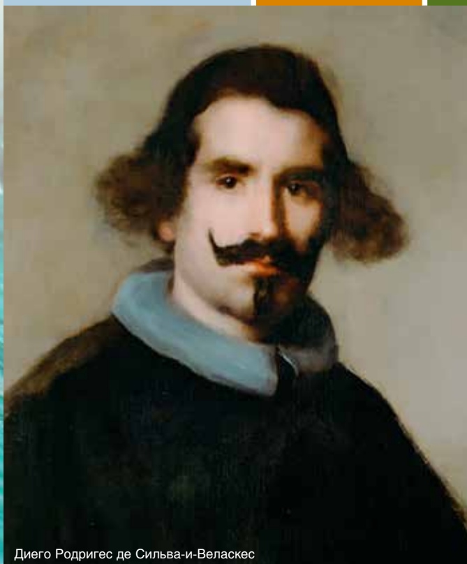
Диего Родригес де Сильва-и-Веласкес