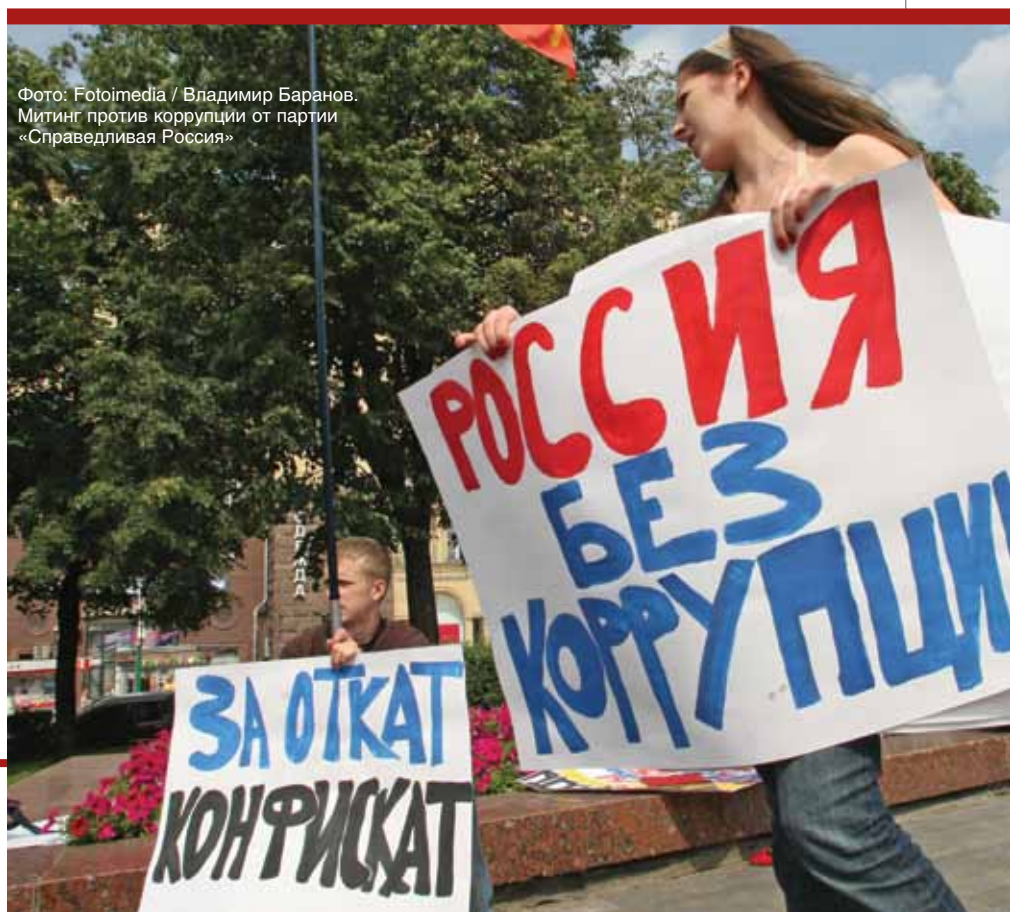
Митинг против коррупции от партии «Справедливая Россия»

уровня системной организации. Кроме того, применение организационного оружия не всегда заметно для традиционных форм научного наблюдения и непонятно в рамках традиционной логики обыденного познания. Деструкция, как действие организационного оружия, направлена на достижение результатов, находящихся в системе ценностей инициатора применения данного оружия.