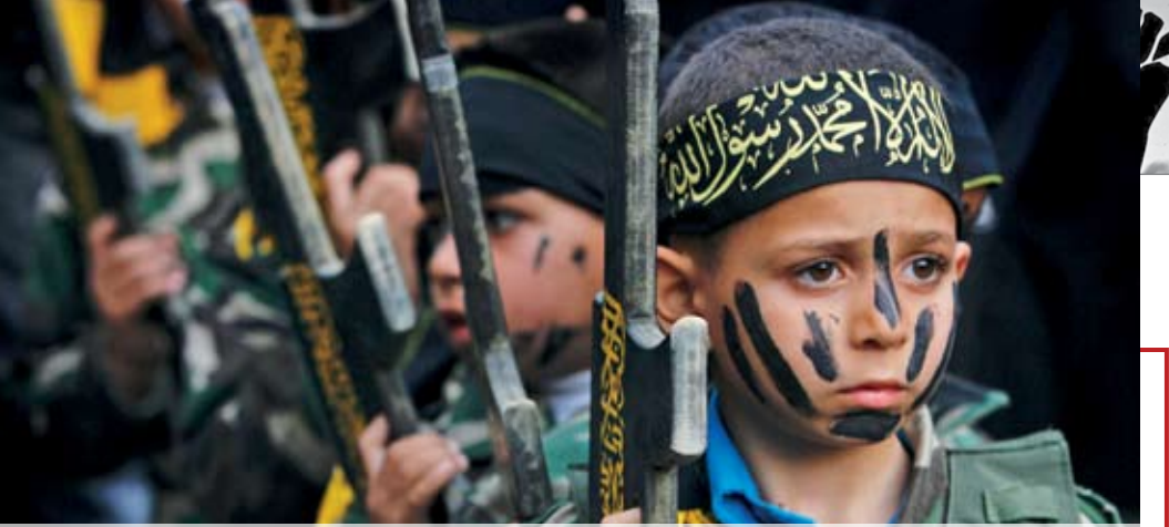
Дети в форме организации «Исламский Джихад». Сектор Газа, 10 марта 2010 г.

му газу, а если труба пойдет через Иорданию и Сирию в Восточную и Южную Европу, «Газпром» потеряет половину европейского рынка. Не знаю, что мы можем сделать в этой ситуации, похоже, ничего. Разбомбить Катар — хорошая идея, но там американская военная база «Аль-Убейд», крупнейшая на Ближнем Востоке. Страна крошечная, куда ни стреляй, попадешь в американцев. А начинать войну с Америкой никто не хочет, даже Иран и Китай.