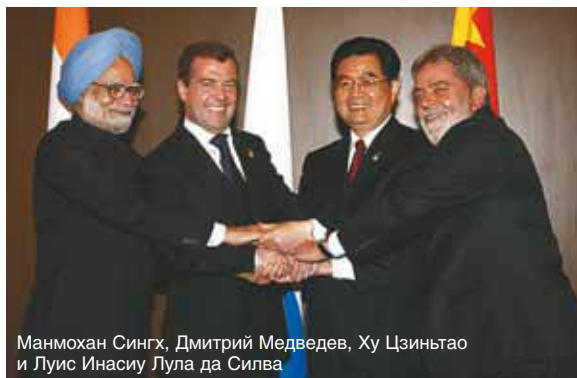
Манмохан Сингх, Дмитрий Медведев, Ху Цзиньтао и Луис Инасиу Лула да Силва

представителем интересов пришедшего к власти экономико-политического клана, озвучивая коллективные потребности этого клана как высшие национальные приоритеты. В таких условиях реальная политическая — либеральная — демократия все больше заменяется демократией