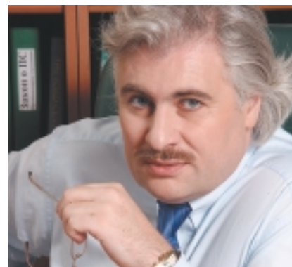
В № 4 журнала «Экономические стратегии» за 2005 г. — интервью с президентом Группы РЕСО Сергеем Эдуардовичем Саркисовым.

1. РС — рейтинг стратегичности; место, занимаемое страховой компанией (С) в рейтинге 50 наиболее стратегичных страховых компаний.