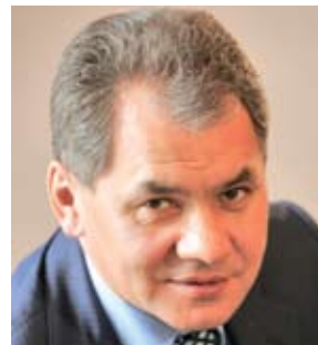
Шойгу Сергей Кужугетович, министр обороны Российской Федерации